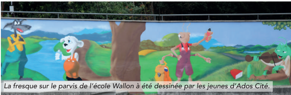
La fresque sur le parvis de l'école Wallon à été dessinée par les jeunes d'Ados Cité.