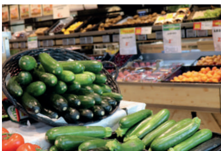
Des produits frais sont proposés toute l'année.