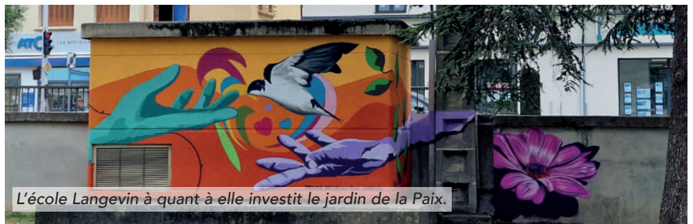
L'école Langevin à quant à elle investit le jardin de la Paix.