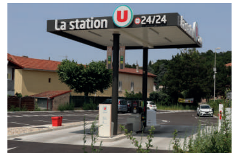
Le magasin est doté d'une station service.

N'hésitez pas à les suivre sur Facebook et Instagram (U Express-Roussillon) pour ne rien manquer de leur actualité !