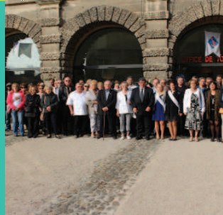
Bienvenue aux nouveaux Roussillonnais