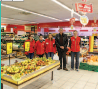
Carrefour Market ouvre ses portes à Roussillon