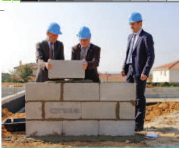
Programme immobilier «Les Arnaudes»