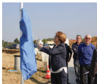
Les familles des personnalités qui ont donné leur nom aux deux rues.

Un programme de 49 logements individuels vient d'être lancé à Roussillon, 20 logements de type T4 seront disponibles en locatif social, et les 29 restants, T3 et T4, seront disponibles en accession sociale.