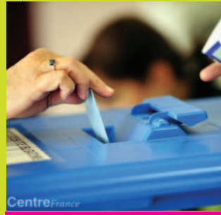
Les bureaux de vote au Sémaphore