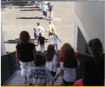
La rentrée des classes