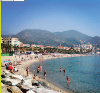
Jumelage Roussillon - Varazze